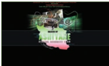
جوانان ایرانی در فضای اینترنت کارهای مختلفی کردند؛ از هک سایت‌های صهیونیستی توسط گروه آشیانه بگیرید تا راه‌اندازی سایت‌های حامی غزه

این روزها فضای اینترنت به‌طور محسوسه‌ای متأثر از درگیری‌های غزه بود. در این میان خیلی از سایت‌های ایرانی هم با ابتکارات خود، به میدان جنگ آمدند