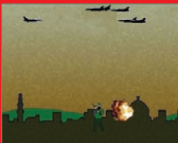
«از غزه دفاع کن» یکی از بازی‌های است که در مورد جنگ غزه ساخته شده یک بازی دیگر هم ساخته‌اند که در ظاهر در حمایت از رژیم صهیونیستی است اما با هوشمندی سازندگان طعنه‌های اساسی بار صهیونیست‌ها می‌کند. برای دانلود این بازی می‌توانید به Tinyurl.com/gazadefender مراجعه کنید