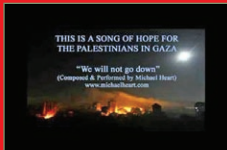
ما غروب نخواهیم کرد این ویدئو کلپ توسط میکائیل هرت، سروده و خوانده شده و محبوب‌ترین ویدئو کلپ درباره غزه در سایت یوتیوب است. یکی دیگر از کلپ‌ها هم کلپ «غزه را آزاد کنید» است. این ویدئو توسط اعضای سایت «غزه را آزاد کنید» در خانه ساخته و از آلمان منتشر شده و در آن ۲ نفر گیتار و تنبور می‌زنند و آفر می‌خوانند