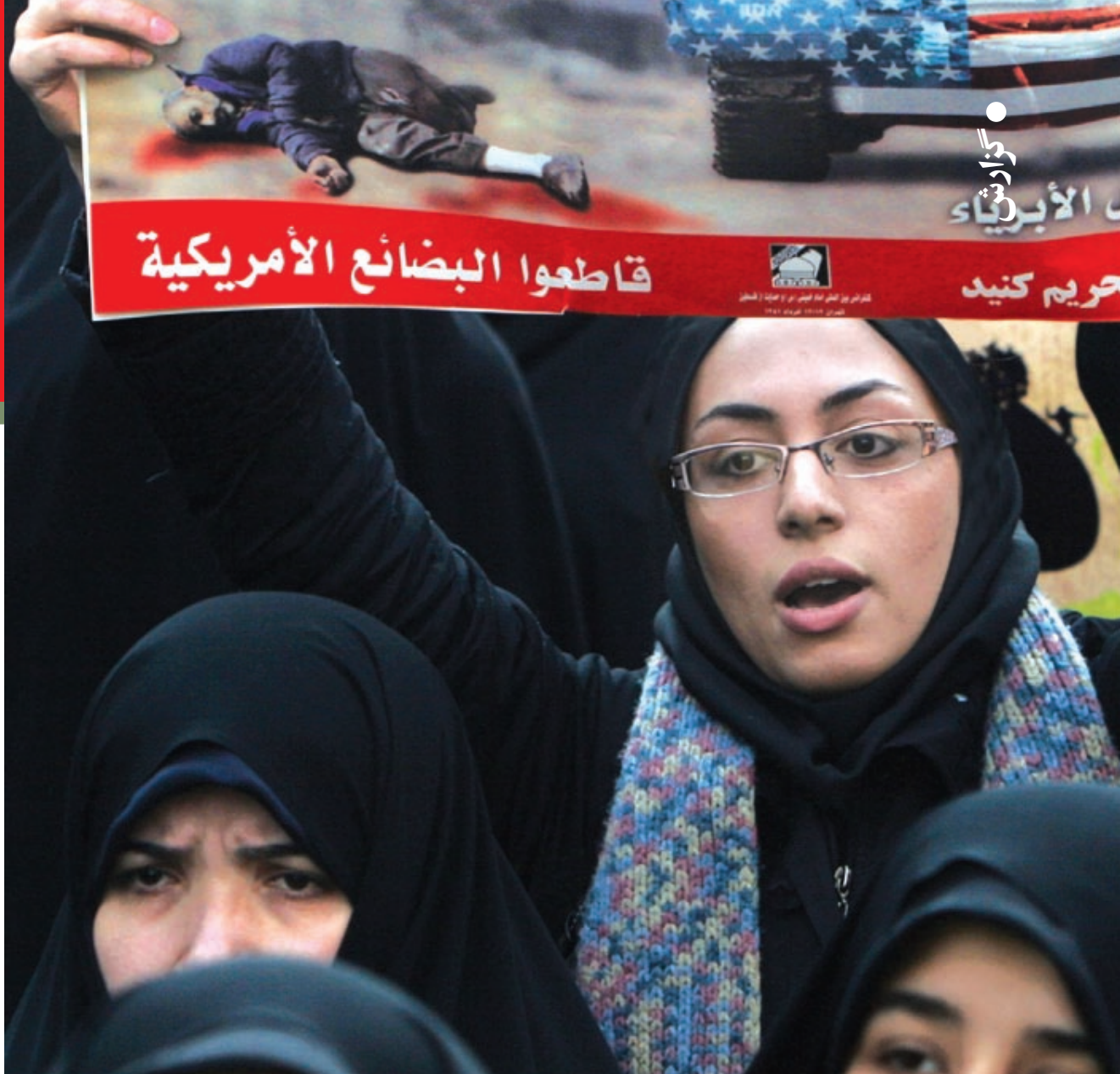
همزمان با تحصن‌ها و راه‌پیمایی‌ها در دفاع از مردم غزه، وبلاگ‌ها و سایت‌ها هم فعال شدند

این همان ابزاری است که وبلاگ انگلیسی «حافظه مستند» ساخته بود که تعداد کشته‌ها و زخمی‌های دو طرف درگیر و روزشمار درگیری را نمایش می‌داد