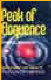
ترجمه عنوان «نهج البلاغه» به انگلیسی می‌شود Peak of Eloquence