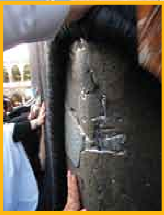
محل شکاف کعبه در موقع تولد امام علی (ع) (مسجدالحرام هروز هم محل قابل رویت است)

امام علی (ع) را دوباره باید شناخت. آن وقت هم می‌توانیم به‌اش افتخار کنیم و هم با افتخار راهش را دنبال کنیم.