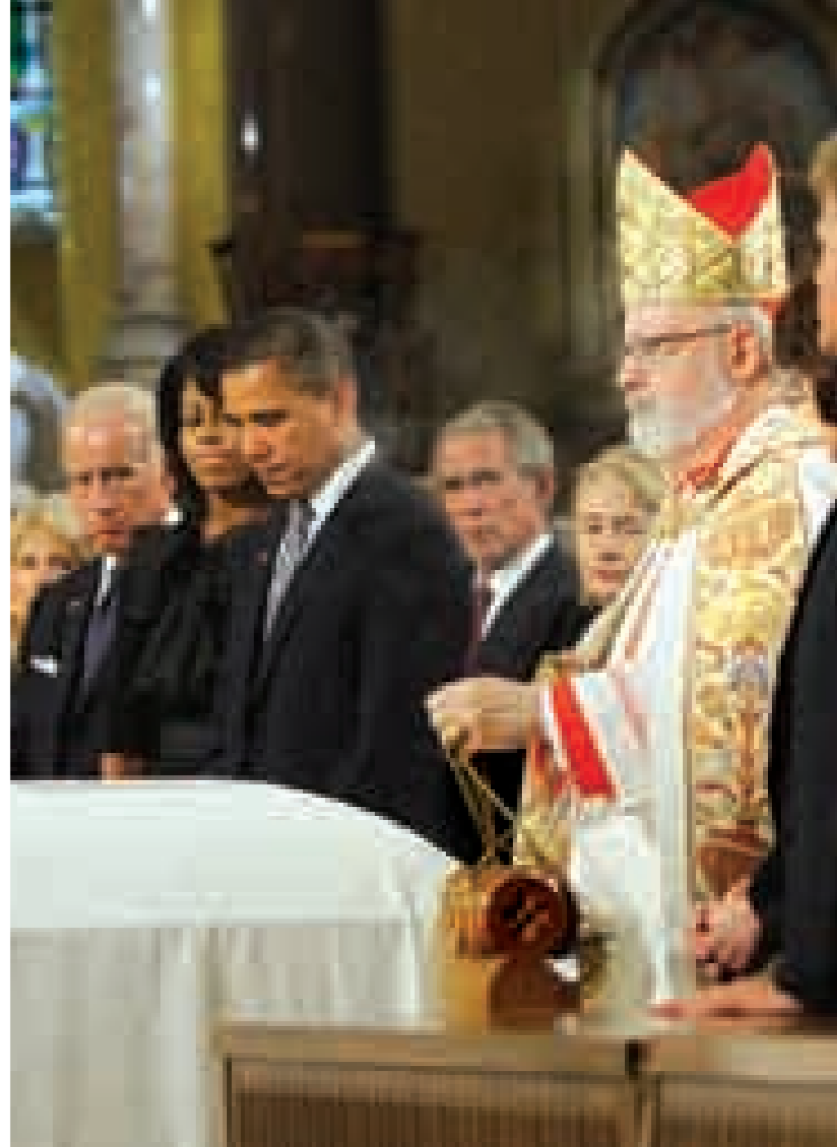
در مراسم تشییع ادوارد کندی، باراک اوباما، جورج دبلیو بوش، کاندولیزا رایس، هیلاری کلینتون، بیل کلینتون (که در این عکس پیدا نیست) و خلاصه هر کی فکرش را می‌کنید حاضر بود

هفته گذشته ادوار دکندی، بزرگ خاندان کندی مرد و بامر گش همهر ادو باره به یاد خانواده پسر و صدا و مهمشان انداخت