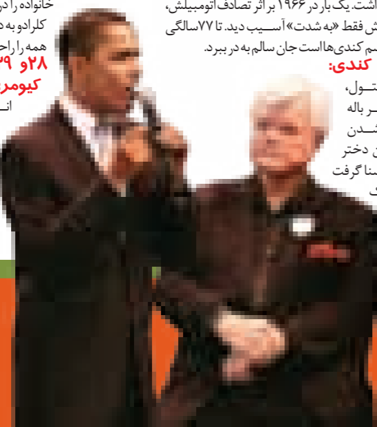
ادوارد کندی در تمام سخنرانی‌های انتخاباتی او با ما حاضر بود

۳۰- روری کی کندی: یازدهمین فرزند رابرت بود که ۶ ماه بعد از مرگ پدر به دنیا آمد و شدیداً از سیاست دوری کرد. او کارگردان فیلم‌های مستند است.