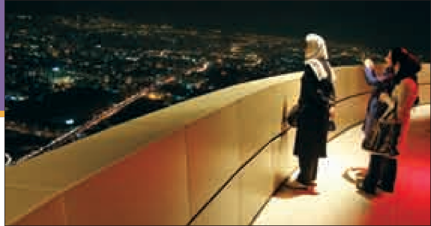
اینجا سکوی دید باز برج میلاد است.