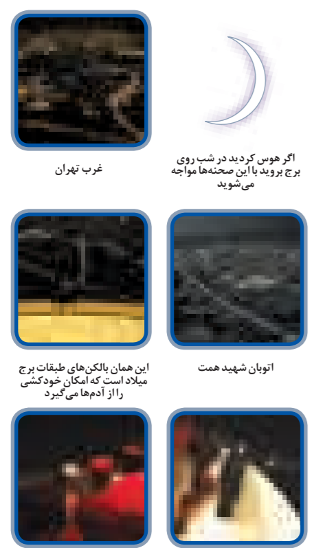
اگر هوس کردید در شب روی برج بروید با این صحنه ها مواجه می شوید غرب تهران اتوبان شهید همت این همان بالکن های طبقات برج میلاد است که امکان خودکشی را از آدم ها می گیرد شب ها هممان ها می توانند با تلسکوپ ماه را ببینند و با دوربین برج آزادی را

۴۵ ثانیه تا بالا شفت اصلی برج کلاینتی است. پس پیخود به راهتما نگویید که شما را وسط راه پیاده کند. در این ستون بتنی شش اسانسور با سرعت هفت متر بر ثانیه نصب شده است. ظرفیت هر اسانسور ۲۵ نفر است که طی ۲۵ ثانیه از نقطه صفر به ارتفاع ۲۹۲ متری می رسد پا به برج، شش طبقه دارد: سه طبقه اولش شامل ۶۸ فروشگاه بزرگ از برندهای معتبر داخلی و خارجی است. البته در این سه طبقه رستوران و کافه تریا و بانک هم به اندازه کافی پیدا خواهید کرد. زیر برج ۲۴ متر استحکامات بتنی دارد که برج را در برابر زلزله ۸/۵ ریشتر زلزله هم مقاوم کرده. پس اگر روزی در تهران زلزله آمد بدانید که امن ترین جا برج میلاد است. اینفو گرافی: مهدی رمضانی