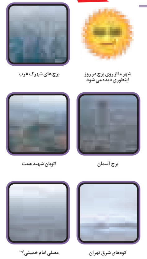
برج های شهرک غرب شهر ما از روی برج در روز اینطوری دیده می شود برج آسمان اتوبان شهید همت کوه های شرق تهران مصلی امام خمینی (ره)